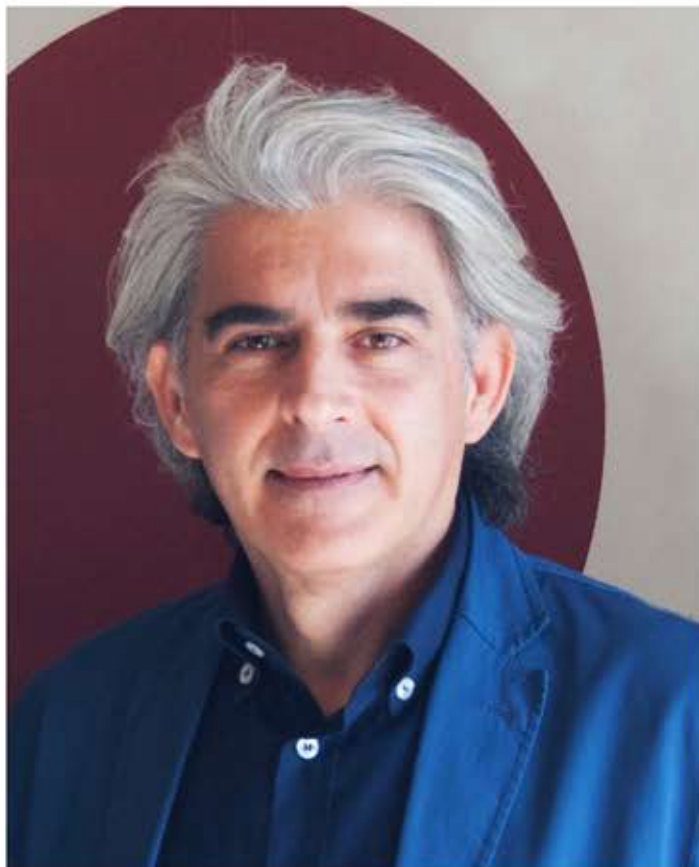
FRANCESCO TANASI – SEGRETARIO NAZIONALE CODACONS

La legge elettorale, la riforma costituzionale e gli organi di garanzia. Analisi degli effetti sulla nomina del Presidente della Repubblica, della Corte costituzionale e delle Autorità indipendenti